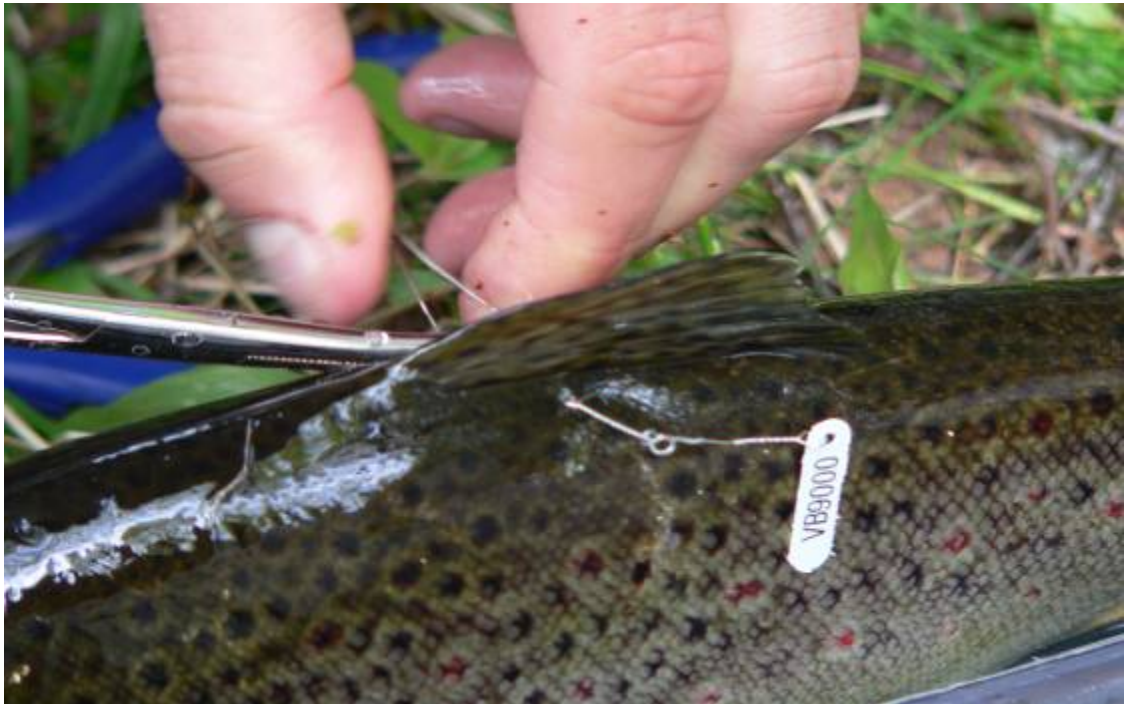
Villin taimenen Carlin-merkintää Siikakoskella.